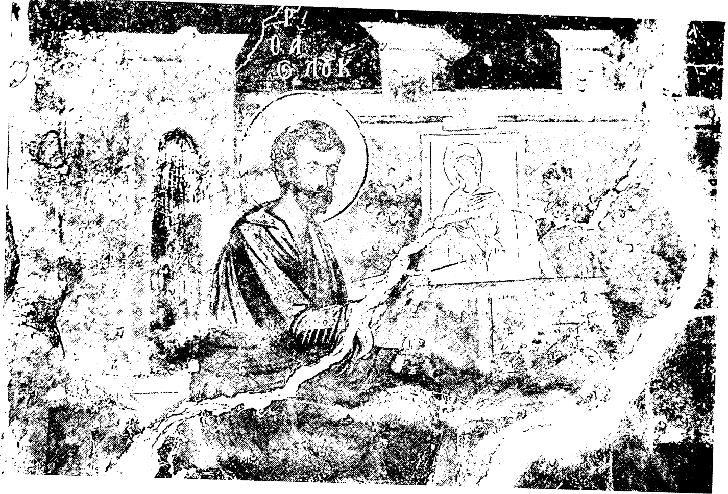
Εικ. 23. Γρανίτσα Ιωαννίνων. Μονή Παναγίας. Ευαγγελιστής Λουκάς