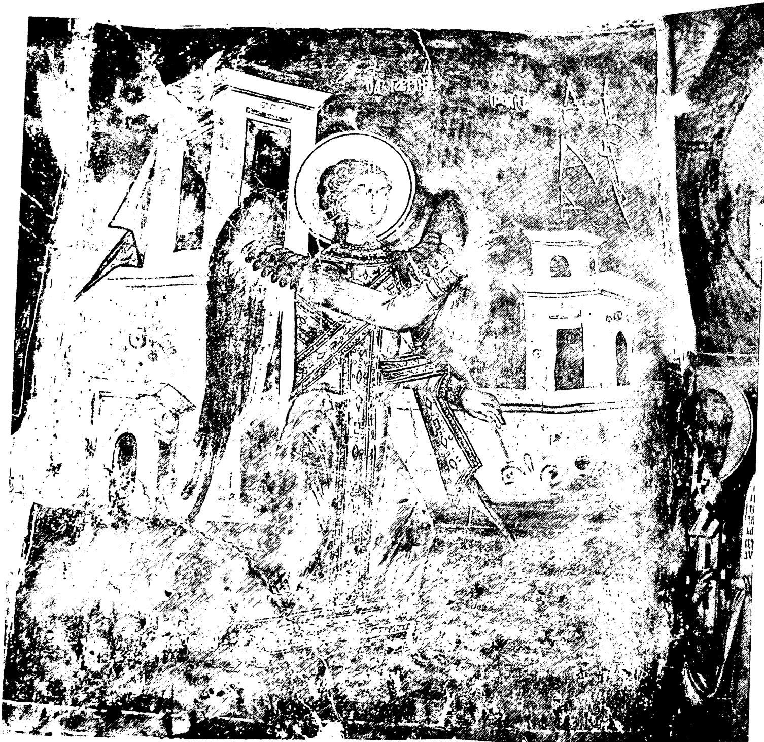
Εικ. 19. Δούβιανη Δρόπολης. Άγιος Νικόλαος. Ευαγγελισμός (αρχάγγελος Γαβριήλ)