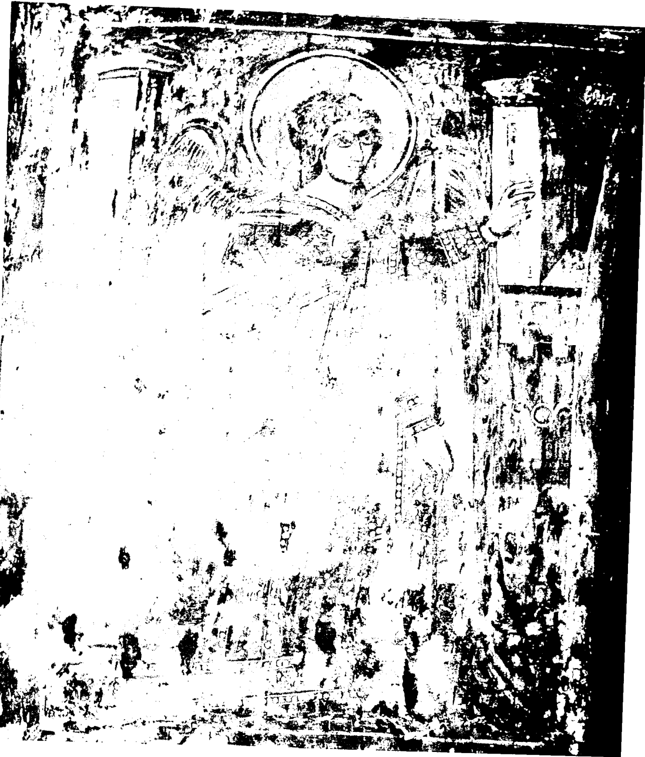
Εικ. 1. Μονοδένδρι. Μονή αγίας Παρασκευής. Ευαγγελισμός (αρχάγγελος Γαβριήλ)