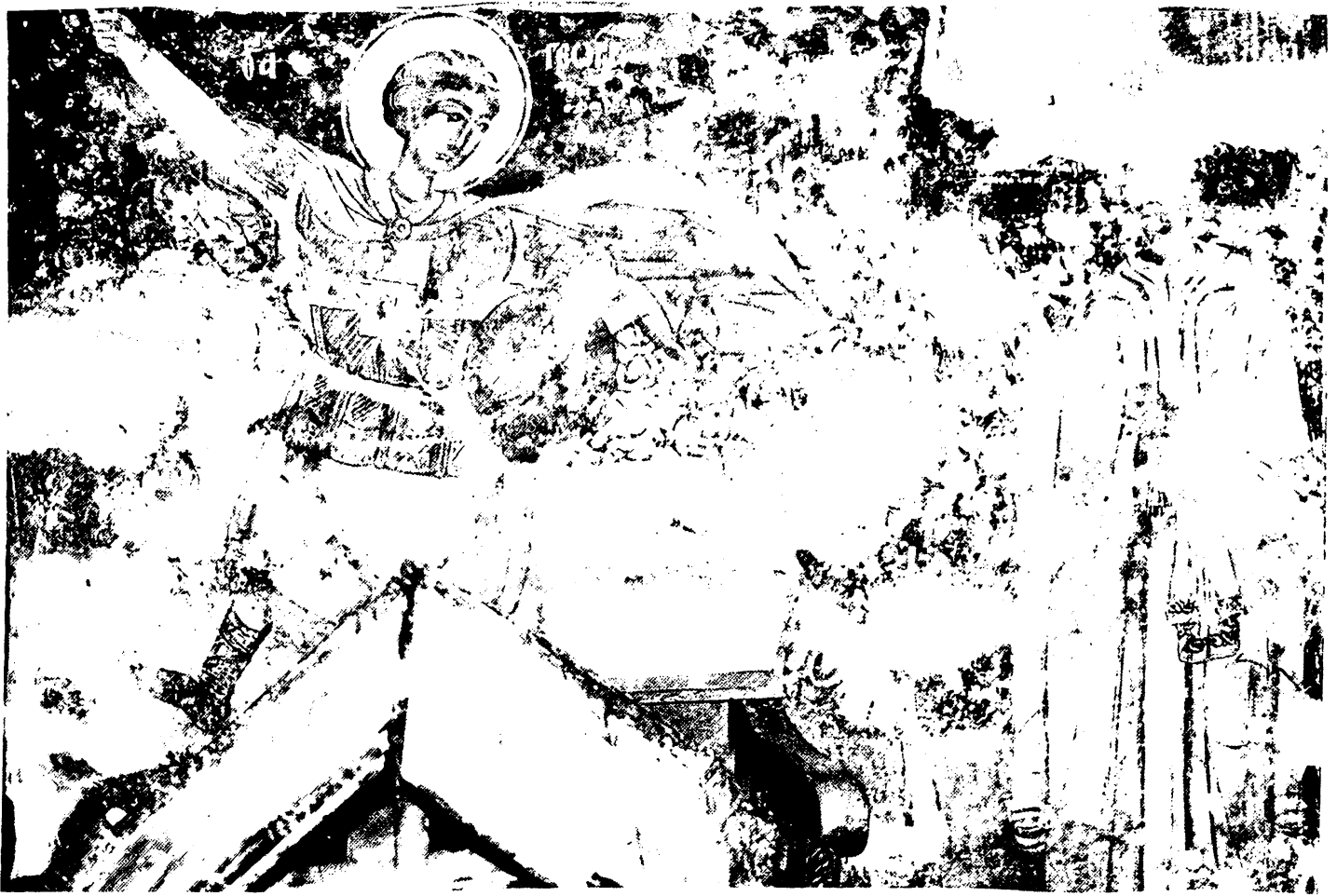
Εικ. 4. Κάτω Λαψίστα Ιωαννίνων. Άγιος Γεώργιος. Άγιος Γεώργιος, κτίτορας