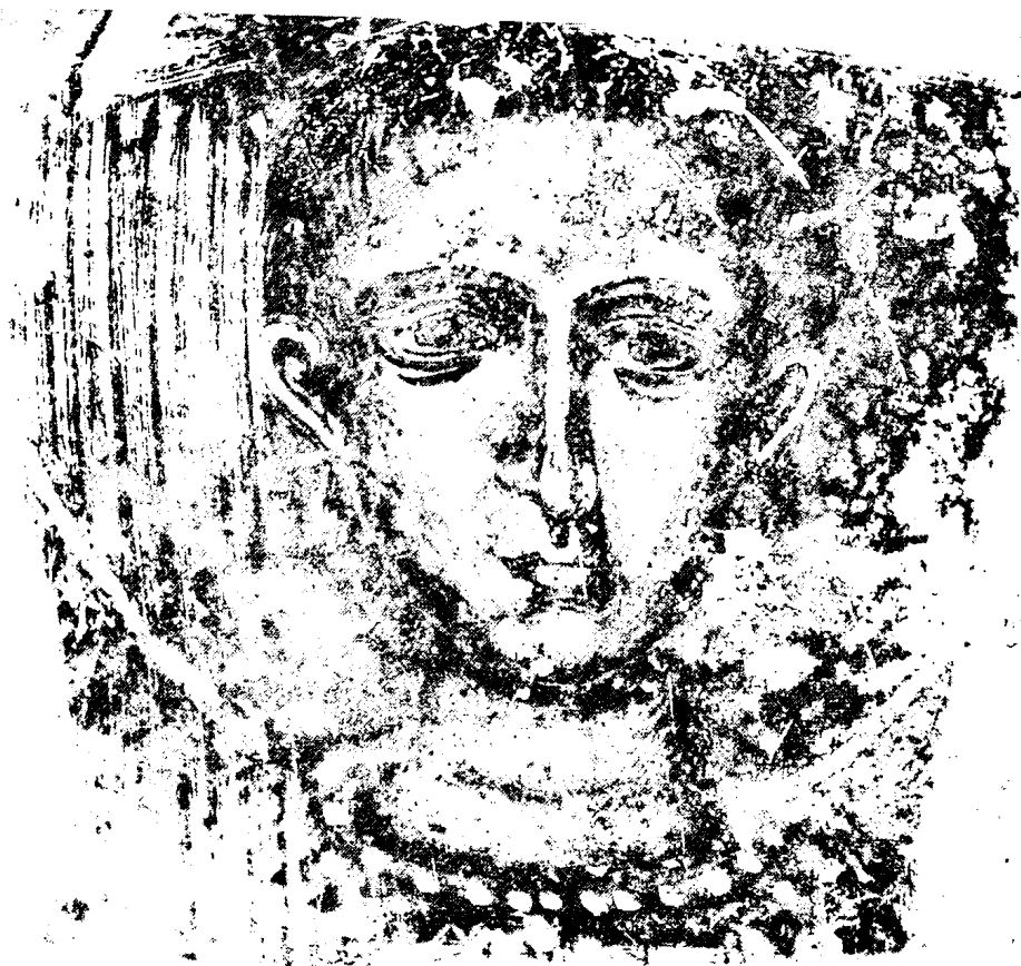
Εικ. 21. Δρυμάδες Χειμάρας. Άγιος Στέφανος. Άγιος