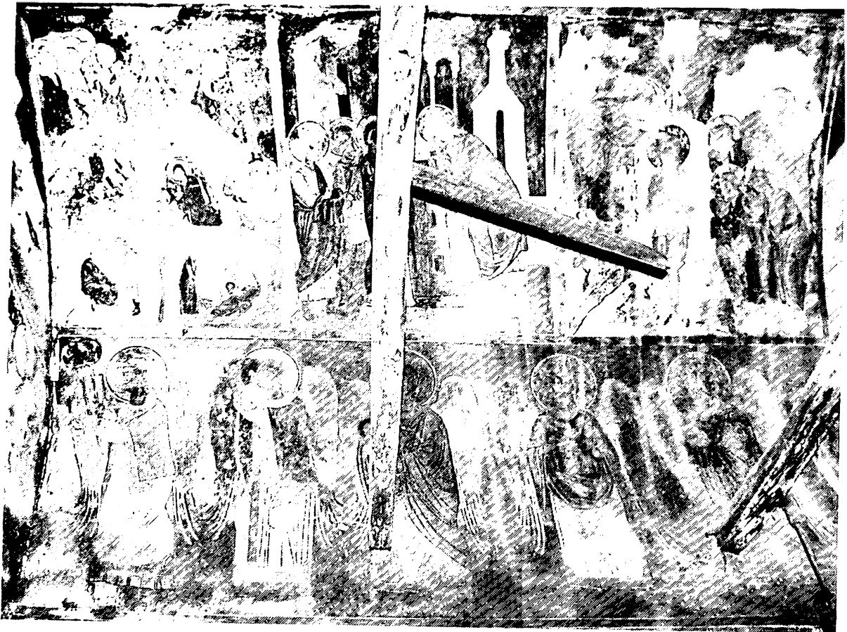
Εικ. 15. Γεωργουτσάτες Δρόπολης. Μονή Προφήτη Ηλία. Γέννηση, Υπαπαντή, Βάπτισμα, Λειτουργία Αγγέλων