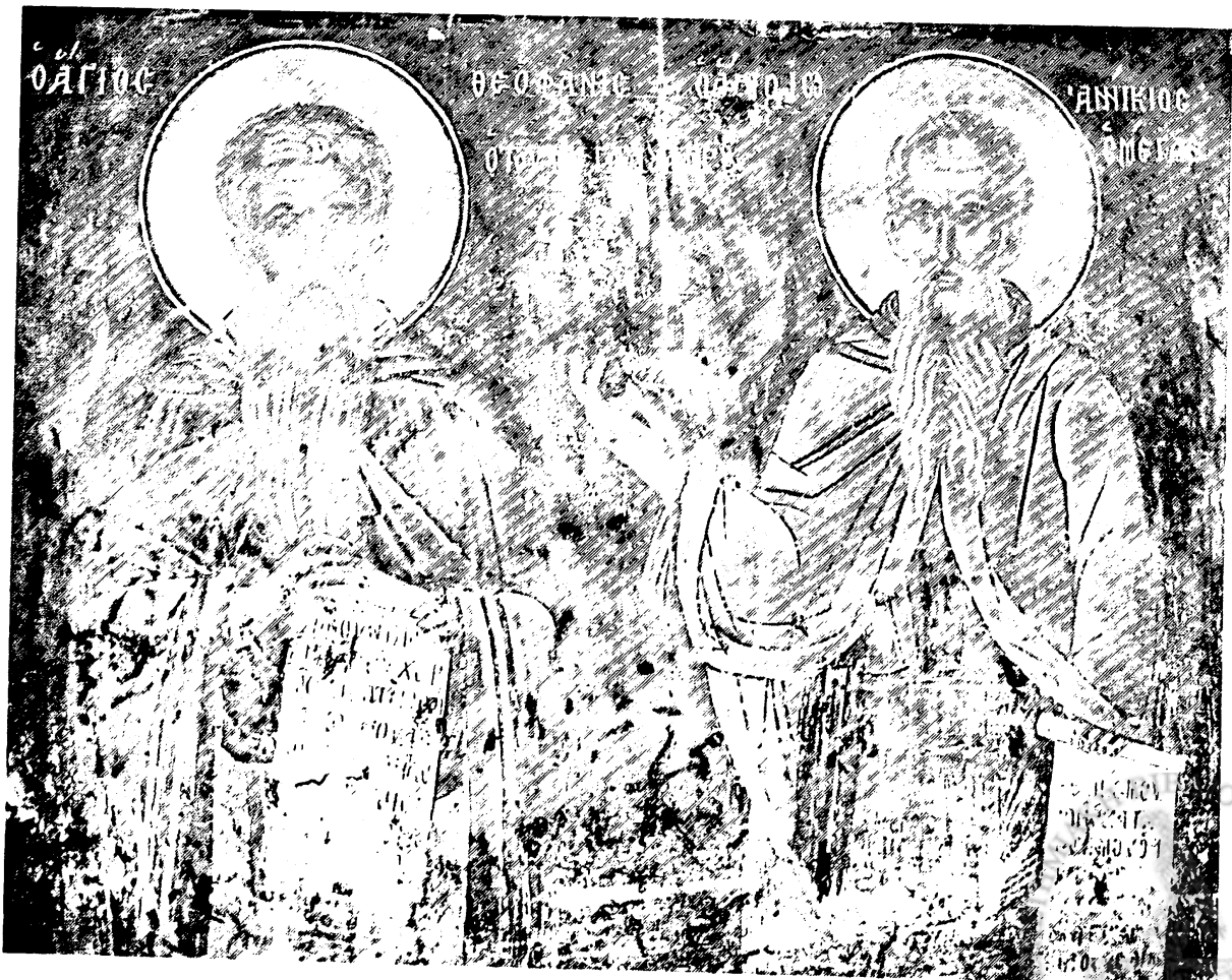
Εικ. 16. Δούβιανη Δρόπολης. Μονή Γενεσίου Θεοτόκου. Άγιοι Θεοφάνης ο του Μεγάλου Αγρού και Ιωαννίκιος ο μέγας