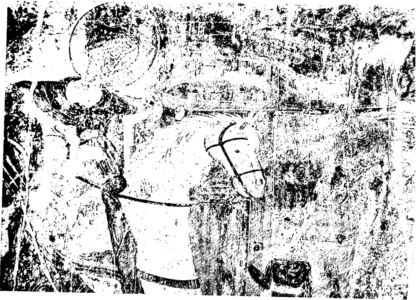
Εικ. 2. Μαλούνι Θεσπρωτίας. Άγιος Νικόλαος. Άγιος Γεώργιος (λεπτομέρεια)