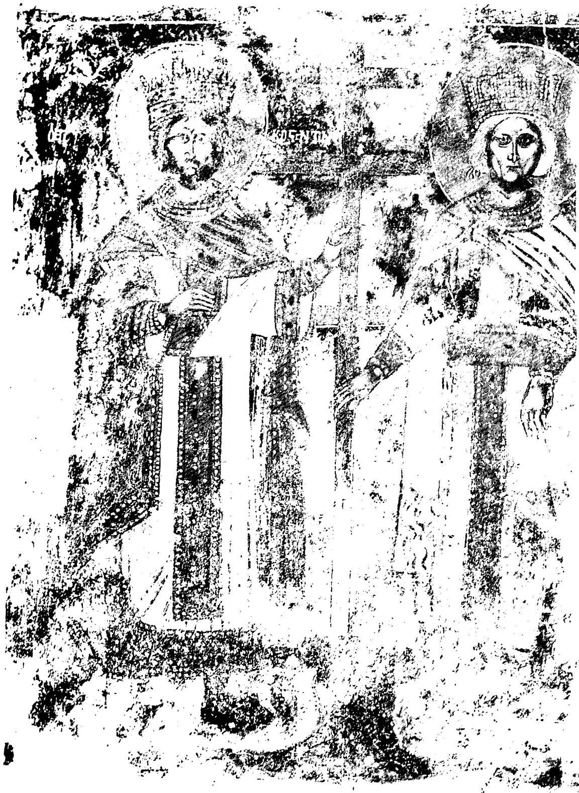
Εικ. 22. Δρυμάδες Χειμάρας. Μονή Υπαπαντής. Άγιοι Κωνσταντίνος και Ελένη

Τοιχογραφημένα μνημεία και ζωγράφοι του 15ου και 16ου αι.