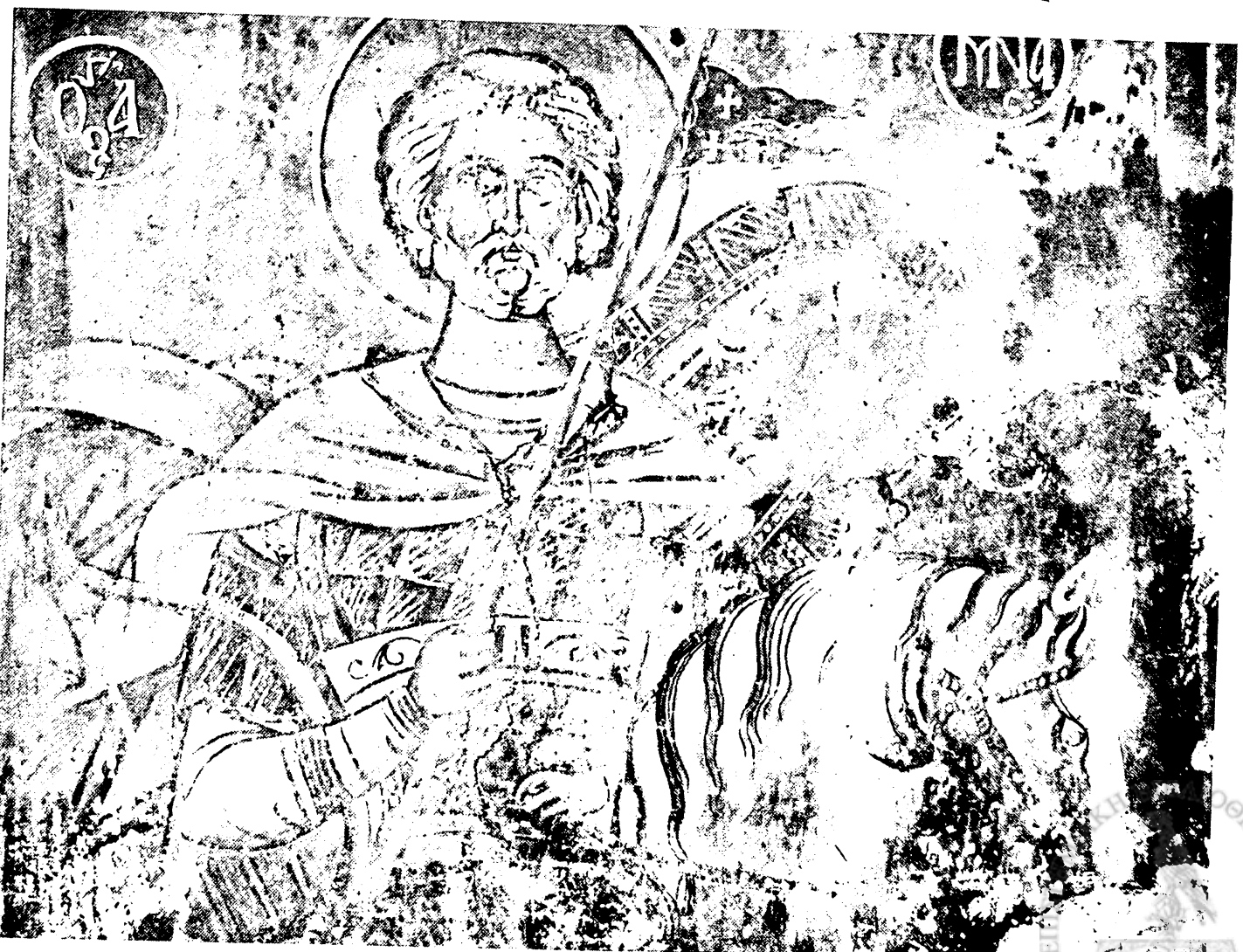
Εικ. 8. Πετσά Δέλβινου. Άγιος Αθανάσιος. Άγιος Μηνάς (λεπτομέρεια)