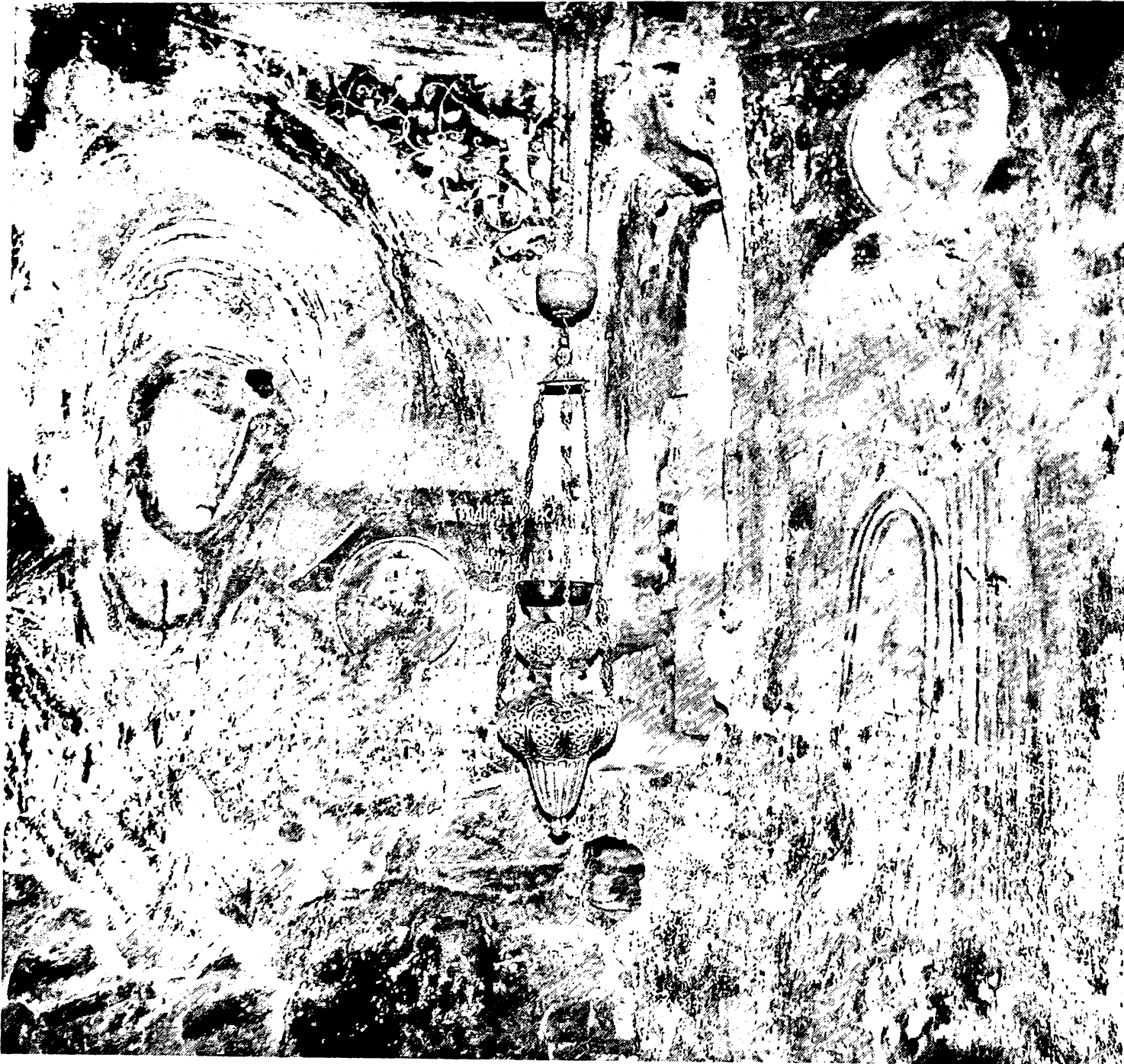
Εικ. 6. Μονή Μολυβδοσκεπάστης. Θεοτόκος Βρεφοκρατούσα, άγιος Γεώργιος