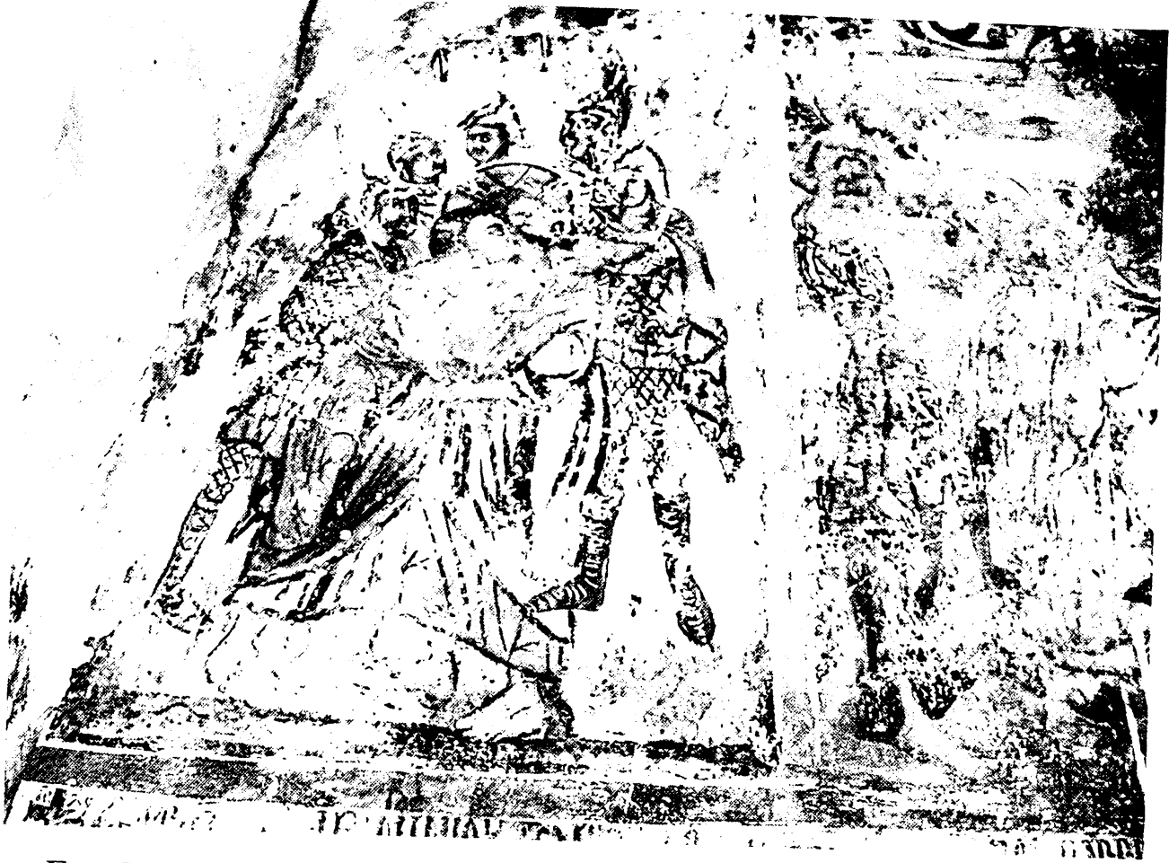
Εικ. 7. Γοραντζή Δρόπολης. Άγιος Αθανάσιος. Επιγραφή, Προδοσία