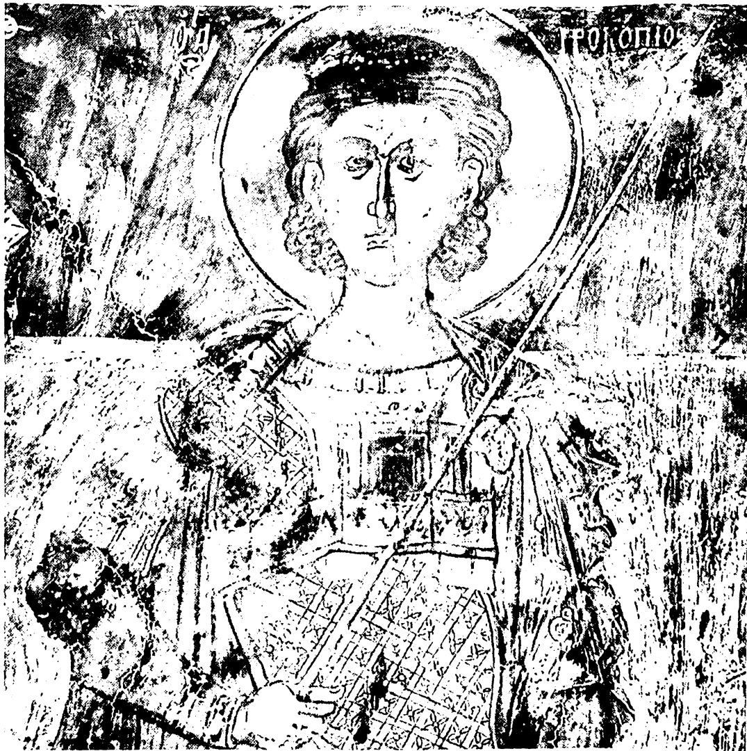
Κάτω Λάβδανη Ιωαννίνων. Μονή Μακουαλέξη. Άγιος Προκόπιος