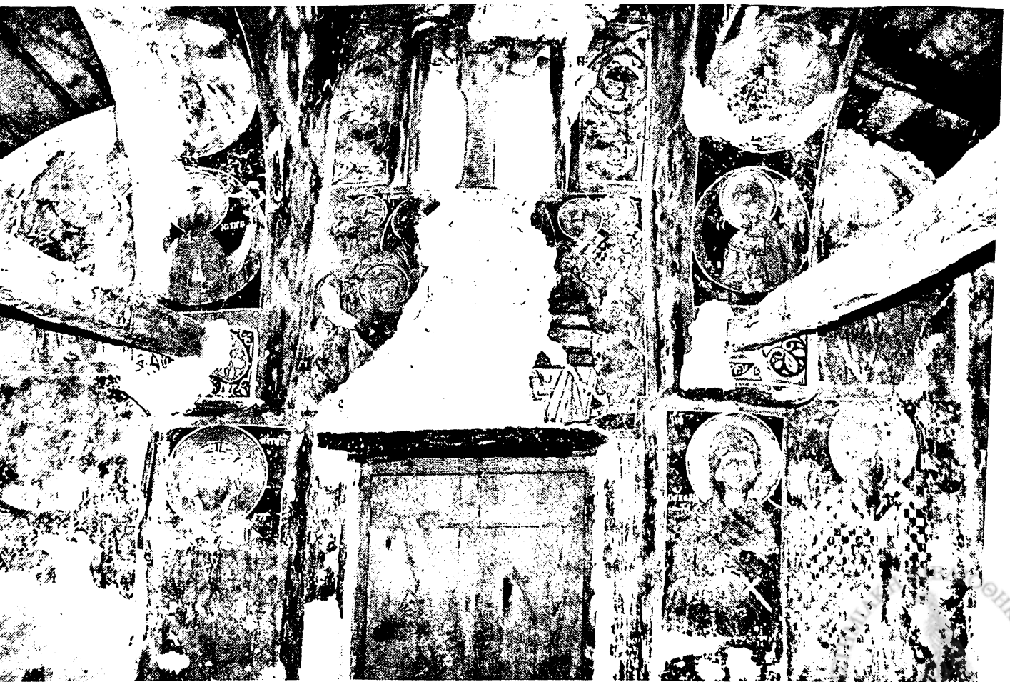
Εικ. 5. Πολίτσιανη. Άγιος Αθανάσιος Μάτζαση. Άποψη δυτικού τοίχου