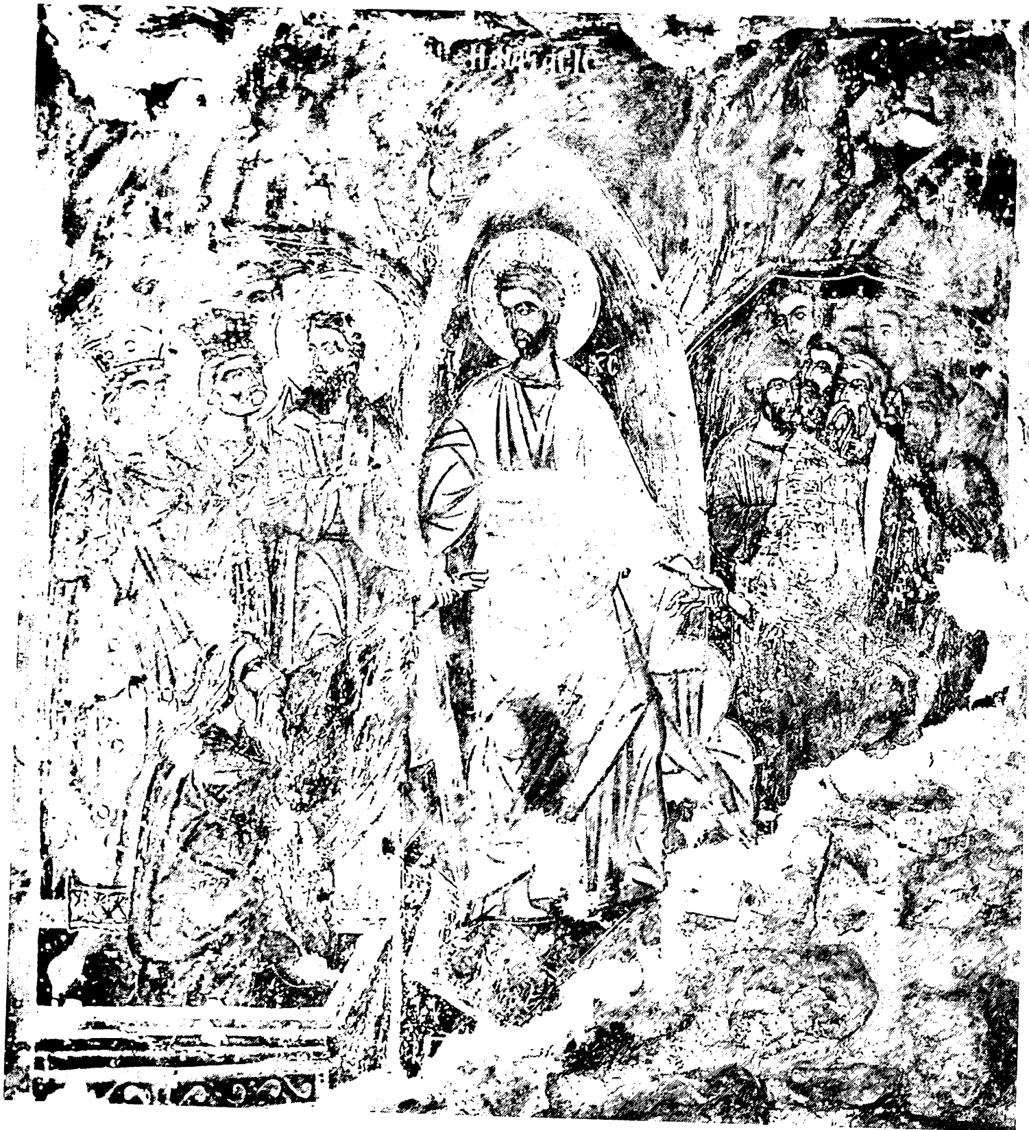
Εικ. 9. Πολίτσειανη. Άγιος Δημήτριος Σάββου. Εις Άδου Κάθοδος