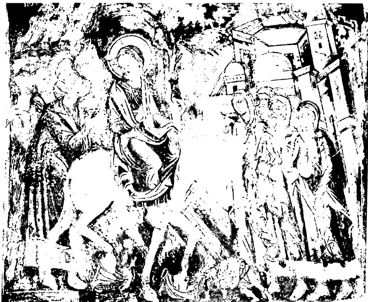
Εικ. 10. Καρίτσα Ιωαννίνων. Μονή Αγίου Νικολάου. Βαΐοφόρος