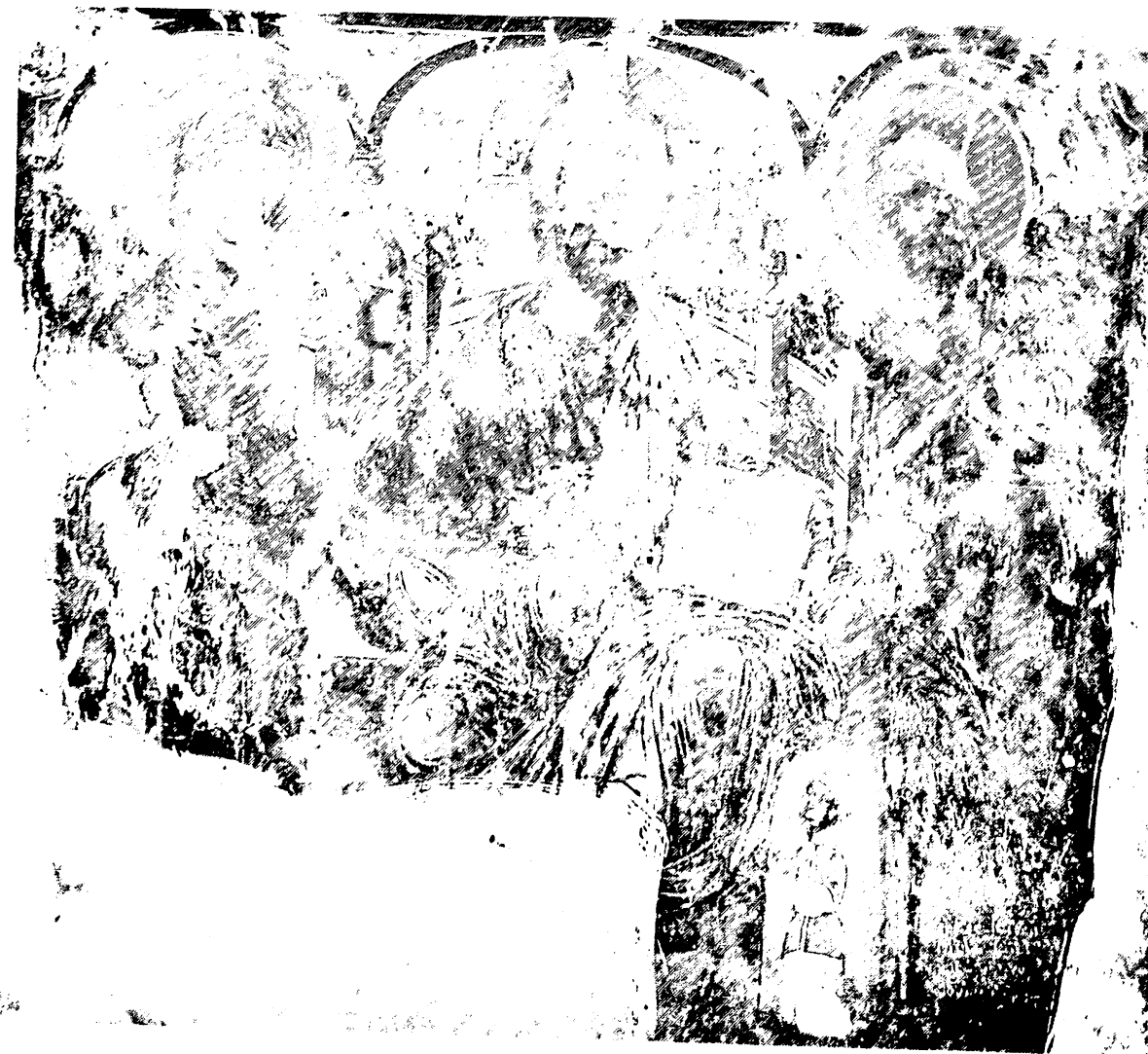
Εικ. 13. Δρυμάδες Χειμάρας. Γενέσιο Θεοτόκου Λένη αιετοφάνης