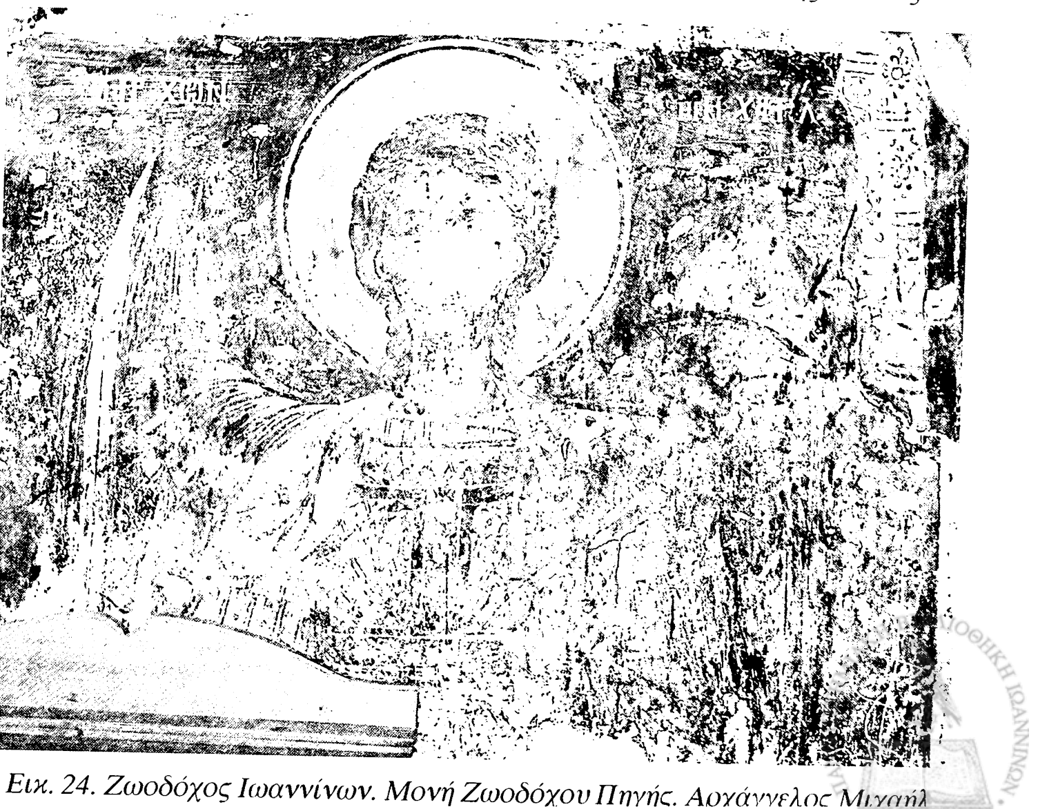
Εικ. 24. Ζωοδόχος Ιωαννίνων. Μονή Ζωοδόχου Πηγής. Αρχάγγελος Μιχαήλ