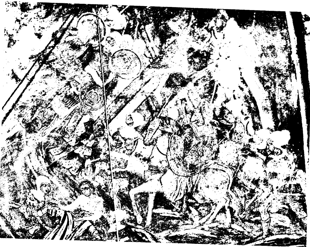
Εικ. 20. Μονή Γηρομερίου. Σταύρωση (λεπτομέρεια)