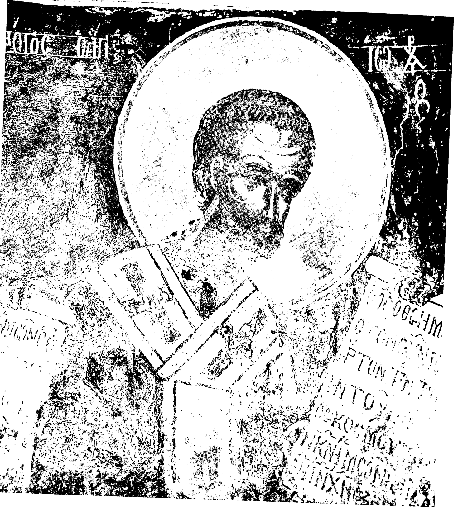
Εικ. 14. Γεωργουτσάτες Δρόπολης. Μονή Προφήτη Ηλία. Άγιος Ιωάννης ο Χουσόστομος