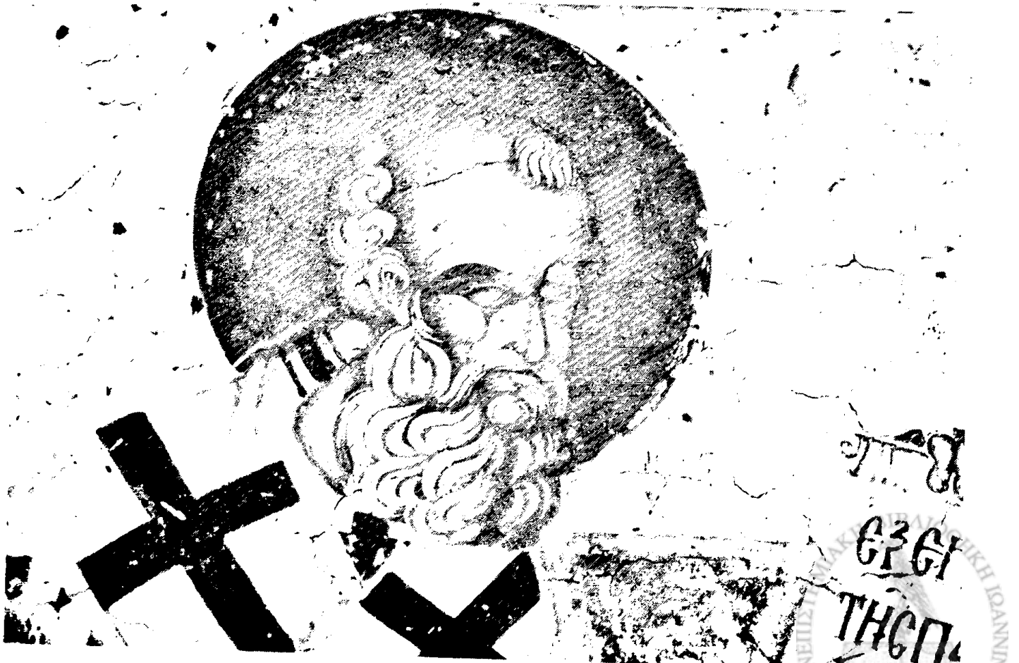
Εικ. 3. Κάτω Μερόπη Πωγωνίου. Κοίμηση Θεοτόκου. Άγιος Αθανάσιος Αλεξανδρίας