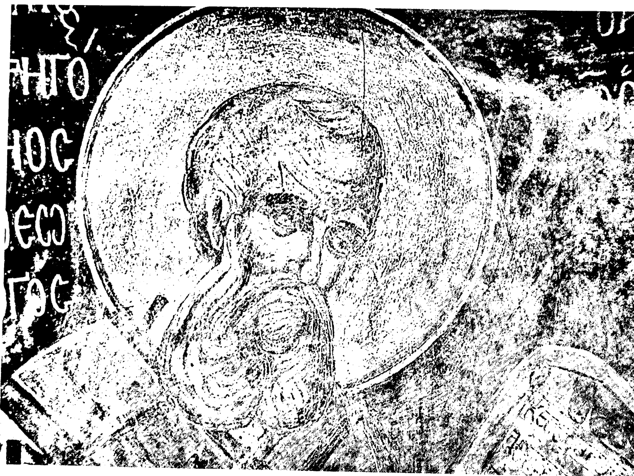
Εικ. 12. Μονή Δρυάνου Δρόπολης. Άγιος Γρηγόριος ο Θεολόγος