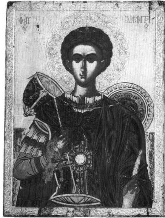
Εικ. 13. Βυζαντινό Μουσείο Αθηνών. Εικόνα του αγίου Δημητρίου.

Το πρώτο αφορά τον τύπο των ανάγλυφων φωτισμένων στα έργα αυτά, με το διακοσμητικό μοτίβο των τεμνόμενων ημικυκλίων, που όμοιοι απαντούν στα βημόθυρα και στην εικόνα της Παναγίας από τη μονή Μακρυαλέξη. Το δεύτερο στοιχείο είναι ότι οι κάτοικοι από το Λινοτόπι επιδίδονταν επίσης στην εκκλησιαστική ξυλογλυπτική και τη χρύσωση τέμπλων, καθώς γνωρίζουμε από μεταγενέστερα παραδείγματα, όπως το τέμπλο της μονής Δουσίκου (1767) 30 , τμήματα του τέμπλου της μονής Μεταμορφώσεως (Μεγάλου Μετεώρου) (1791) 31 , τα τέμπλα της μονής της Παναγίας στην