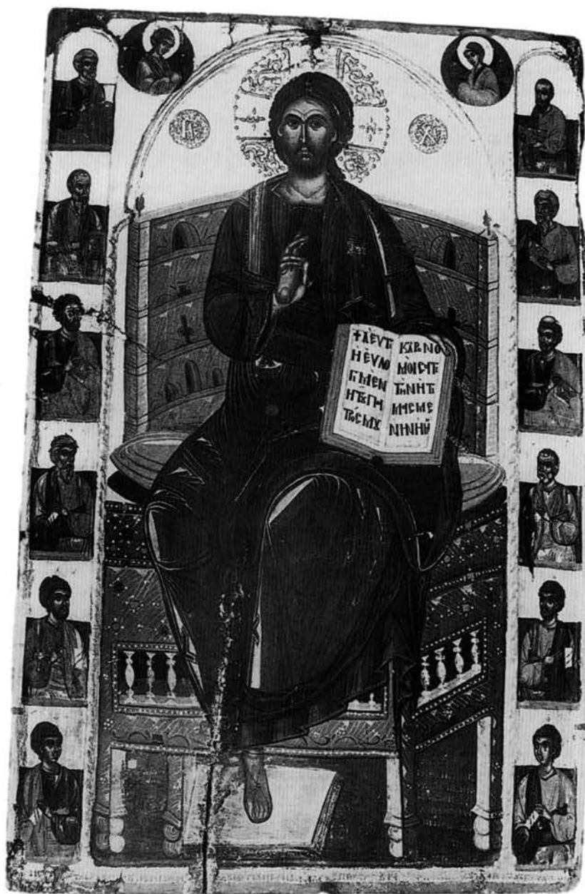
Εικ. 1. Βυζαντινό Μουσείο Ιωαννίνων. Εικόνα Παντοκράτορα από τη μονή Μακροαλέξη.