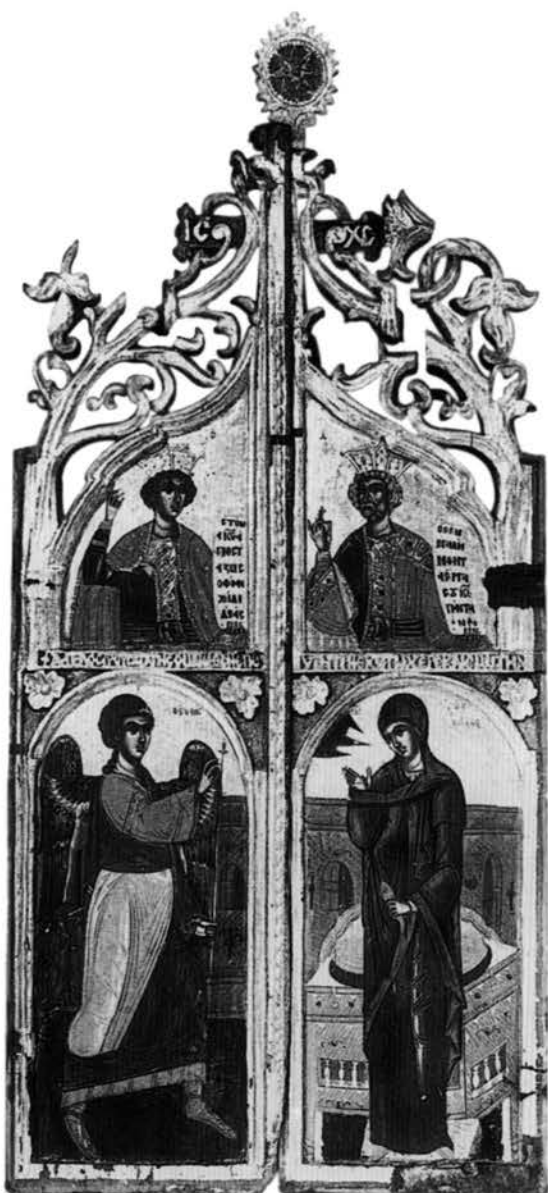
Εικ. 5. Βυζαντινό Μουσείο Ιωαννίνων. Βημόθυρα από τη μονή Μακρυαλέξη.