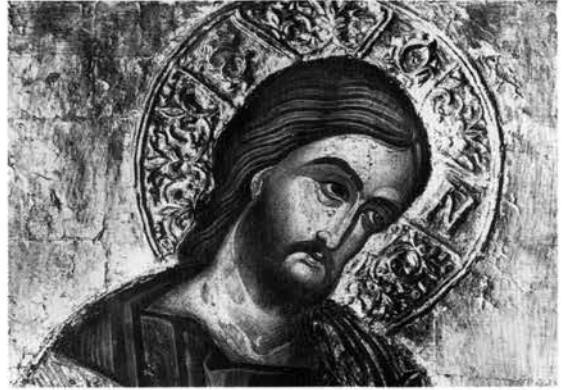
Εικ. 3. Λεπτομέρεια τοιχογραφίας στη μονή Βαρλαάμ.

τον οποίο προέρχονται από το συσχετισμό αυτό προκύπτουν ενδιαφέροντα στοιχεία για τα διαδοχικά στάδια πραγμάτωσης του συνόλου της διακόσμησης ενός ναού και το ρόλο του ζωγράφου σε αυτή. Από την άποψη αυτή ενδιαφέρον παρουσιάζει ένας αριθμός εικόνων που οφείλονται σε ζωγράφους από το Λινοτόπι, το ορεινό χωριό του Γράμμου στο νομό Καστοριάς, κατεστραμμένο ήδη από τα τέλη του 18ου αιώνα 3 . Ορισμένες από τις εικόνες είναι ενυπόγραφες, ενώ άλλες μπορούν να αποδοθούν σε ζωγράφους με βεβαιότητα.