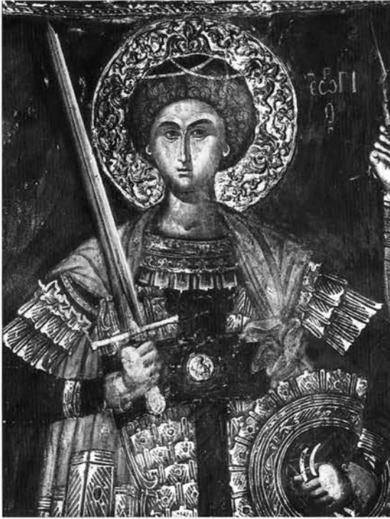
Εικ. 12. Ο άγιος Γεώργιος, τοιχογραφία στη μονή Βαρλαάμ.

ριοχή της Άνω Μακεδονίας. Το Λινοτόπι, γενέτειρα του ζωγράφου Νικολάου, βρισκόταν στην περιοχή αυτή και υπαγόταν στη Μητρόπολη Καστοριάς, υποκειμένη στην Αρχιεπισκοπή Αχρίδας. Άλλωστε, και οι απεικονίσεις του αγίου Αχιλλείου και του αγίου Κλήμεντος Αχρίδας στις τοιχογραφίες του ιερού του ναού των Παλατιτίων υποδηλώνουν προέλευση του ζωγράφου από περιοχή που βρισκόταν στην εκκλησιαστική δικαιοδοσία της αρχιεπισκοπής αυτής 29 .