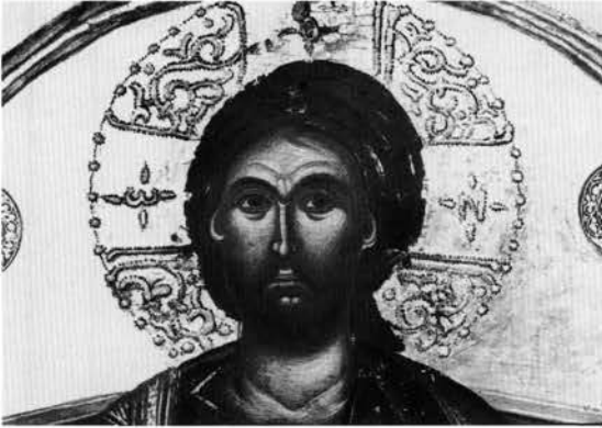
Εικ. 2. Λεπτομέρεια της εικόνας του Παντοκράτορα από τη μονή Μακροαλέξη.