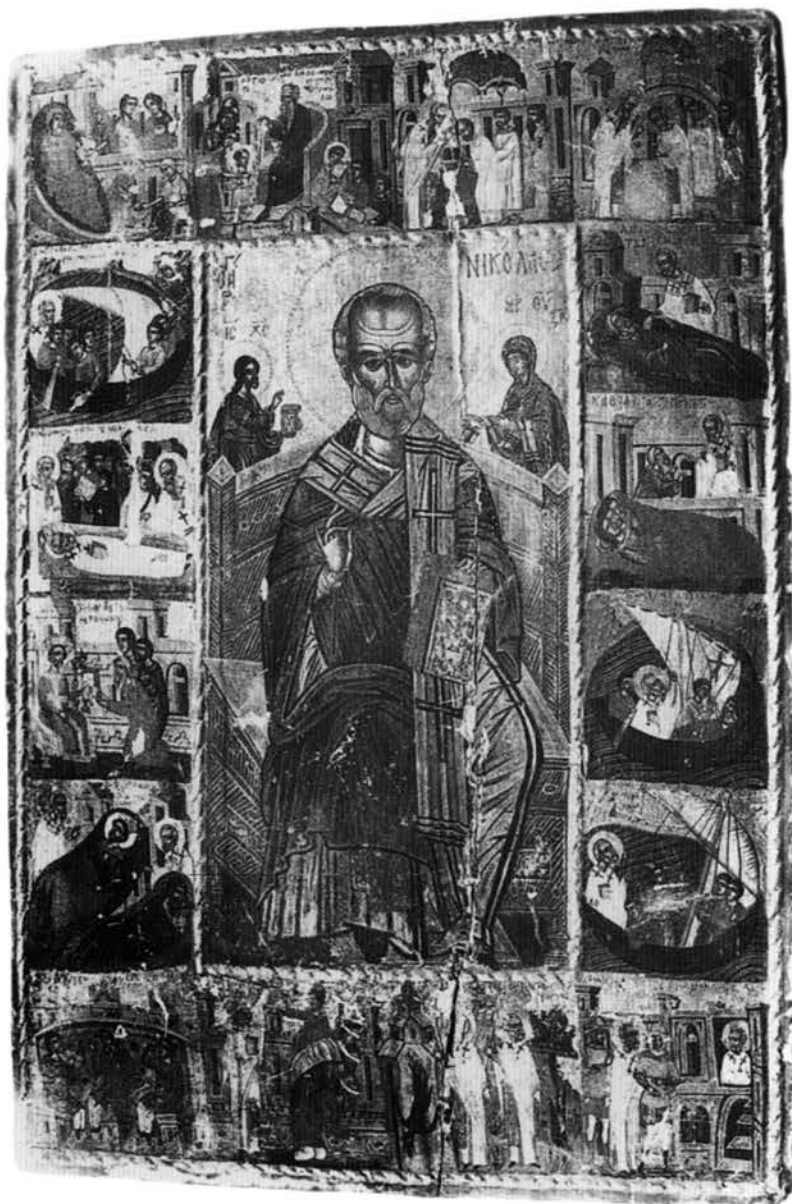
Εικ. 17. Εικόνα του αγίου Νικολάου με σκηνές του βίου του από το ναό του Αγίου Νικολάου στην Κλειδωνιά Κονίτσης.