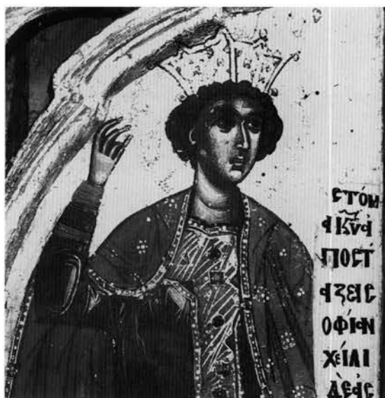
Εικ. 6. Ο προφητάναξ Σολομών. Λεπτομέρεια του βημόθυρου από τη μονή Μακρυαλέξη.