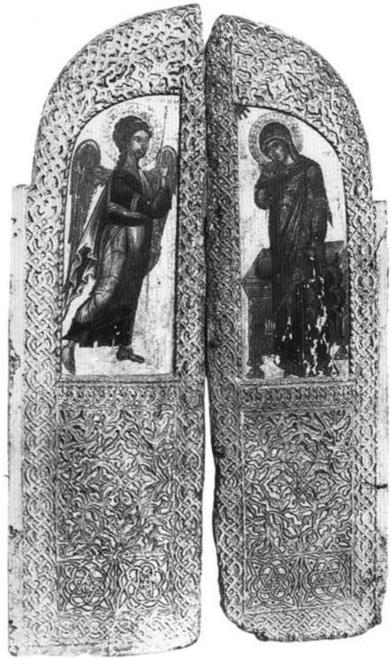
Εικ. 10. Συλλογή εικόνων Βέροιας. Βημόθυρα από το ναό του Αγίου Δημητρίου στα Παλατίτσια.

Στη συλλογή εικόνων της Βέροιας φυλάσσεται μια εικό- να με παράσταση του αγίου Γεωργίου ημίσωμου (Εικ. 11) και βημόθυρα με παράσταση του Ευαγγελισμού (Εικ. 10), όλα προερχόμενα από το ναό του Αγίου Δη- μητρίου στα Παλατίτσια. Ο Θ. Παπαζώτος απέδωσε τα έργα αυτά στον ίδιο ζωγράφο, τον οποίο ταύτισε με τον ανώνυμο ζωγράφο Δ' των τοιχογραφιών του ναού στα Παλατίτσια 24 .