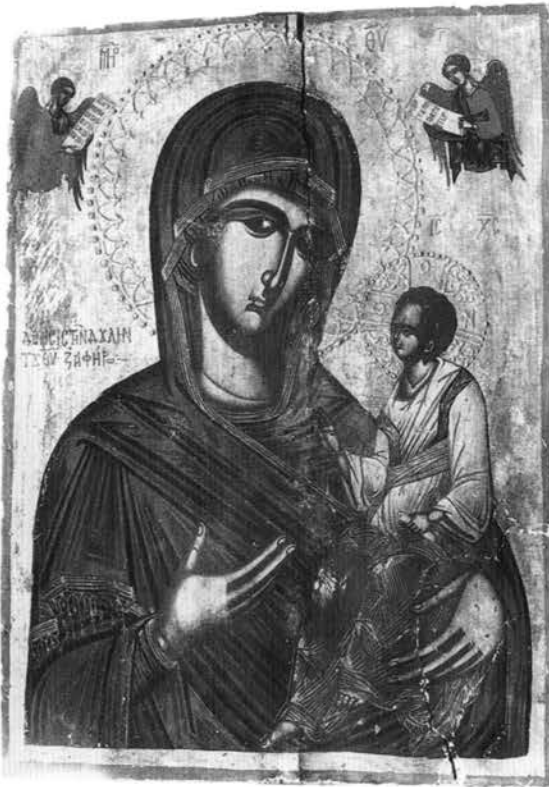
Εικ. 15. Εικόνα της Παναγίας Οδηγήτριας από το ναό του Αγίου Νικολάου στην Κλειδωνιά.

Όπως συνάγεται από τα έργα που παρουσιάστηκαν, οι ζωγράφοι από το Λινοτόπι αναλάμβαναν συνήθως, εκτός από τις τοιχογραφίες ενός ναού, και τη ζωγραφική των δεσποτικών εικόνων, των βημόθυρων και γενικά των γραπτών μερών του τέμπλου, όπως το επιστύλιο. Η διαπίστωση αυτή πιθανότατα αντανακλά μια γενικότερη πρακτική των παραγγελιοδοτών μιας τοιχογράφησης, να αναθέτουν δηλαδή στο ζωγράφο της και