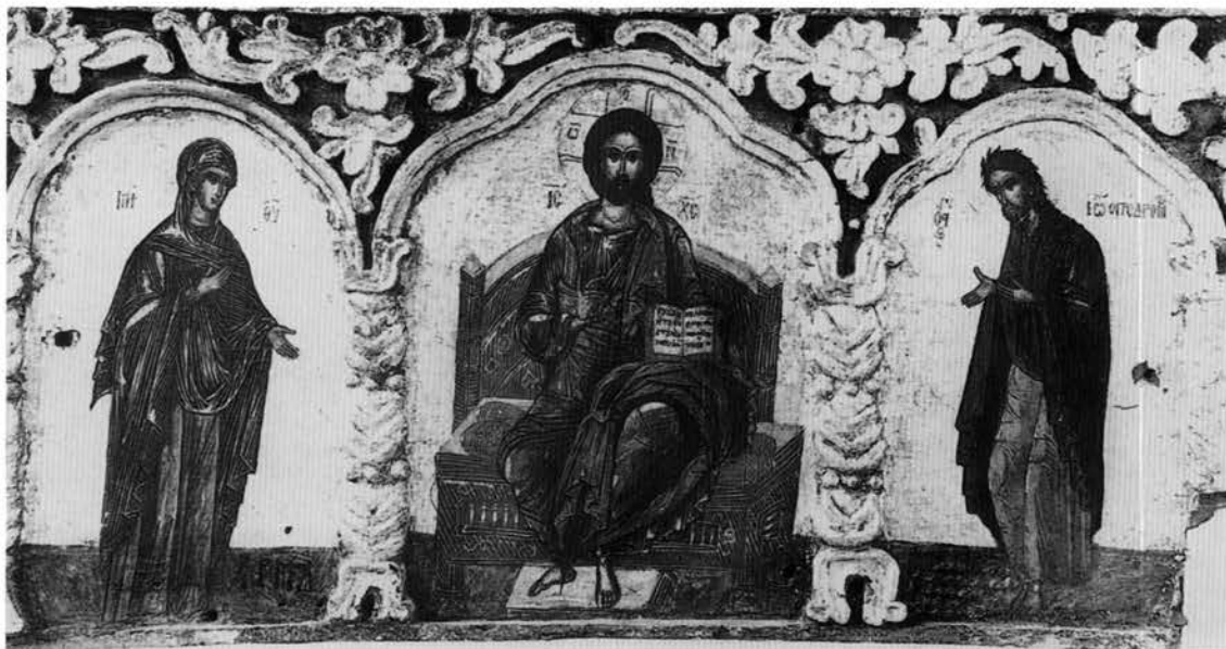
Εικ. 9. Βυζαντινό Μουσείο Ιωαννίνων. Επιστόλιο τέμπλον από το ναό της Κοίμησης της Θεοτόκου στο Κονκούλι Ζαγορίου.

Από τις επιγραφές των εικόνων της μονής Μακρυαλέξη προκύπτουν ορισμένες ενδιαφέρουσες διαπιστώσεις. Καταρχήν, ότι οι δύο ζωγράφοι ασκούσαν εξίσου τη ζωγραφική του τοίχου και των φορητών εικόνων. Ακόμα, ότι τους ανατέθηκε πρώτα η ζωγραφική των εικόνων και κατόπιν του καθολικού. Αυτό σημαίνει πως οι μοναχοί, λόγω των περιορισμένων οικονομικών τους, δεν μπόρεσαν να προχωρήσουν στην ιστόρηση του καθολικού ευθύς μετά την ολοκλήρωση της ανέγερσής του, παρήγγειλαν όμως στους δύο ζωγράφους τις εικόνες εκείνες που ήταν απαραίτητες στην τέλεση των ιερουργιών. Όταν αργότερα τα οικονομικά τους το επέτρεψαν, απευθύνθηκαν στους ίδιους ζωγράφους για την τοιχογράφηση του καθολικού, προφανώς ικανοποιημένοι από την ποιότητα της προηγούμενης εργασίας τους. Η περίπτωση της μονής Μακρυαλέξη προσφέρει ένα