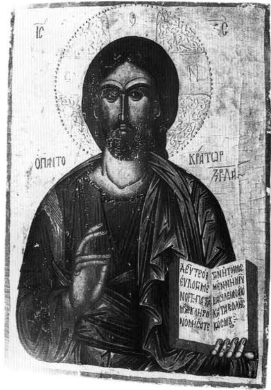
Εικ. 16. Εικόνα του Χριστού Παντοκράτορα από το ναό του Αγίου Νικολάου στην Κλειδωνιά.

Όπως συνάγεται από τα έργα που παρουσιάστηκαν, οι ζωγράφοι από το Λινοτόπι αναλάμβαναν συνήθως, εκτός από τις τοιχογραφίες ενός ναού, και τη ζωγραφική των δεσποτικών εικόνων, των βημόθυρων και γενικά των γραπτών μερών του τέμπλου, όπως το επιστύλιο. Η διαπίστωση αυτή πιθανότατα αντανακλά μια γενικότερη πρακτική των παραγγελιοδοτών μιας τοιχογράφησης, να αναθέτουν δηλαδή στο ζωγράφο της και