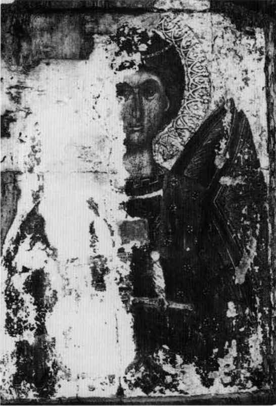
Εικ. 11. Συλλογή εικόνων Βέροιας. Εικόνα αγίου Γεωργίου από το ναό του Αγίου Δημητρίου στα Παλατίσια.

μόνος που μνημονεύεται στην επιγραφή του 1570 στο νότιο τοίχο της πρόθεσης 25 . Στον Νικόλαο έχω αποδώσει, εκτός από τις τοιχογραφίες του ιερού, και ορισμένους αγίους στο βόρειο τοίχο, όπως τον άγιο Προκόπιο, με τον οποίο παρουσιάζει πολλές ομοιότητες ο άγιος Γεώργιος της εικόνας, όπως σωστά παρατήρησε ο Παπαζώτος. Το εικονογραφικό πρότυπο του αγίου Γεωργίου –ως