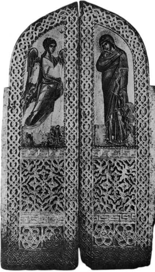
Εικ. 14. Εθνικό Μουσείο Βελιγραδίου. Βημόθυρα από την Αχρίδα.

Κλεισούρα του νομού Καστοριάς (1772) 32 και του ναού του Αγίου Νικολάου στη Μόλιστα της περιοχής Κονίτσης (1782) 33 . Δεν είναι ίσως άτοπο να υποθεθεί ότι τη