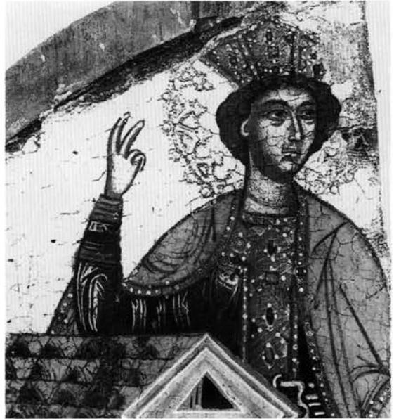
Εικ. 8. Ο προφήταναξ Σολομών. Λεπτομέρεια του βημόθυρου από το ναό της Κοίμησης της Θεοτόκου στο Κονκούλι.

γραφικές και τεχνοτροπικές συνάψεις με τη ζωγραφική στα βημόθυρα από το ναό της Κοίμησης της Θεοτόκου στο Κονκούλι Ζαγορίου, τα οποία επίσης εκτίθενται στο Βυζαντινό Μουσείο Ιωαννίνων 18 (Εικ. 7-8). Τα τελευταία, που δεν απέχουν χρονικά από τα βημόθυρα