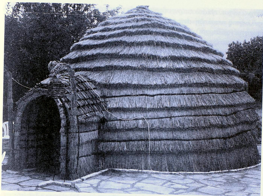
Νεότερη υποδειγματική αρβανιτοβλάχικη καλύβα (καλατζούκα) στο Δολό Παγωνίου

Στα γκεσέμια κρεμούσαν τα κουδούνια ( κυπριά ) για να ακούγεται ο ήχος και να ακολουθούν τα άλλα ζώα. Πιο παλιά τα μικρά και τα μεγάλα ζώα (κυρίως τα κατσίκια) τα άφηναν μαζί. Τώρα όμως και δεκαπέντε χρόνια τα χωρίζουν την ημέρα και τα βάζουν τη νύχτα μαζί. Τα αρνιά τα απόκοβαν σε 40-45 ημέρες και τα κατσίκια σε δύο μήνες. Και αυτό γιατί τα κατσίκια που δεν είναι δυναμωμένα θέλουν περισσότερο γάλα. Το γάλα που περίσσευε το έδιναν στον τυροκόμο. Παλαιότερα τυροκομούσαν οι ίδιοι στο βουνό, όπου υπήρχε ειδική εγκατάσταση, το μπατζαριό . Αυτό γίνεται και σήμερα μερικές φορές το καλοκαίρι. Φτιάχνουν κεφαλοτύρι και μυζήθρα, ενώ βγάζουν και το φρέσκο βούτυρο και το ξινόγαλα, χτυπώντας το γάλα σε ειδικό ξύλινο δοχείο, την «τρουνπολίτσα», δουλειά που την έκαναν οι γυναίκες. Από το 1950 και ύστερα δημιουργήθηκαν οργανωμένα τυροκομεία, με πρώτο αυτό του Αλέκου Πότση. Ακολούθησαν ο Μήτσος Πορίχης, ο Δημήτρης Γραμμόζης κ.ά. Σημειώνω ότι η γαλακτοφορία των ζώων παρατεινόταν τουλάχιστον για ένα μήνα από τη φυσιολογική κατάσταση με τη μεταφορά των ζώων στα ορεινά (Chang 1993: 694).