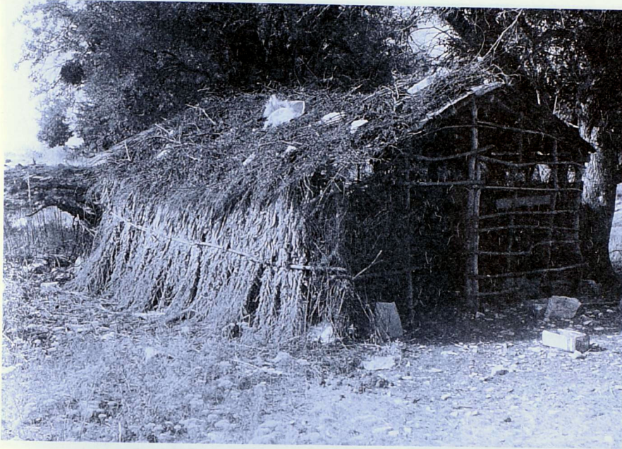
Καλύβα από χόρτα που χρησιμοποιεί για μπατζαριό (τυροκομείο) στη Νεμέρτσικα

πό γέροντες κύρους 70-85 ετών) και τις διευθετούσε. Τα σύνορα τα σημάδευαν με πέτρες τη μια πάνω στην άλλη. Τα σημάδια αυτά τα ονόμαζαν κύρκους ή κουμπουράδες .