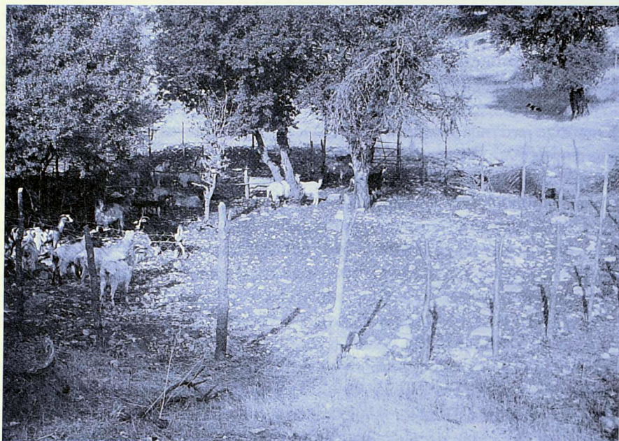
Σύγχρονο μαντρί με παλούκια και σύρμα στη Νεμέτσοικα

γωγικά, γιατί το γάλα που έκαναν ήταν καλύτερο (έχει περισσότερες θερμίδες, πρωτεΐνες και λίπος) και ακριβότερο στην τιμή, αλλά και για το μαλλί τους. Από τους υπολογισμούς που έχουν κάνει ειδικοί, δέκα προβατίνες είναι επαρκείς για τη συντήρηση ενός ατόμου, ενώ αντίθετα χρειάζονται είκοσι γίδες (Glatzer & Casimir 1983: 320). Τα πρόβατα όμως ήθελαν περισσότερη φροντίδα. Αυτά άλλωστε είναι πιο ευαίσθητα στο κρύο, ενώ τα γίδια μπορούσαν να βγουν έξω και με χιόνια, να βρουν, όπως λένε, «ξύλο για να φάνε».