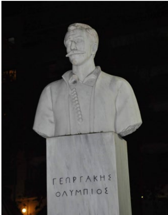
Εικόνα 9. Προτομή του Γεωργάκη Ολύμπιου, Τόπος – Λάρισα

Σημειωτική τεκμηρίωση του έργου (Εικ. 8): Υλικό: Ορειχάλκινη προτομή Βλέμμα: Στερεοτυπικό πλάγιο βλέμμα, στραμμένο πάνω και δεξιά, ό.π. Μορφολογικά σημαίνοντα: Πάνω σε μαρμάρινη βάση στηρίζεται ορειχάλκινη προτομή χωρίς άκρα σε ώριμη ηλικία και αυστηρό ύφος. Πομπός-παραγγελιοδότης: Σύλλογος Λιβαδιωτών Θεσσαλονίκης «Ο Γεωργάκης Ολύμπιος», που σημαίνει την τοπικότητα της καταγωγής του αγωνιστή. Πομπός-δημιουργός: Ευθύμης Καλεβράς (1929-2011). Χώρος τοποθέτησης: Πλατεία ΧΑΝΘ Θεσσαλονίκης. Χρονολογία τοποθέτησης: Τα αποκαλυπτήρια πραγματοποιήθηκαν στις 21 Νοεμβρίου 1993.