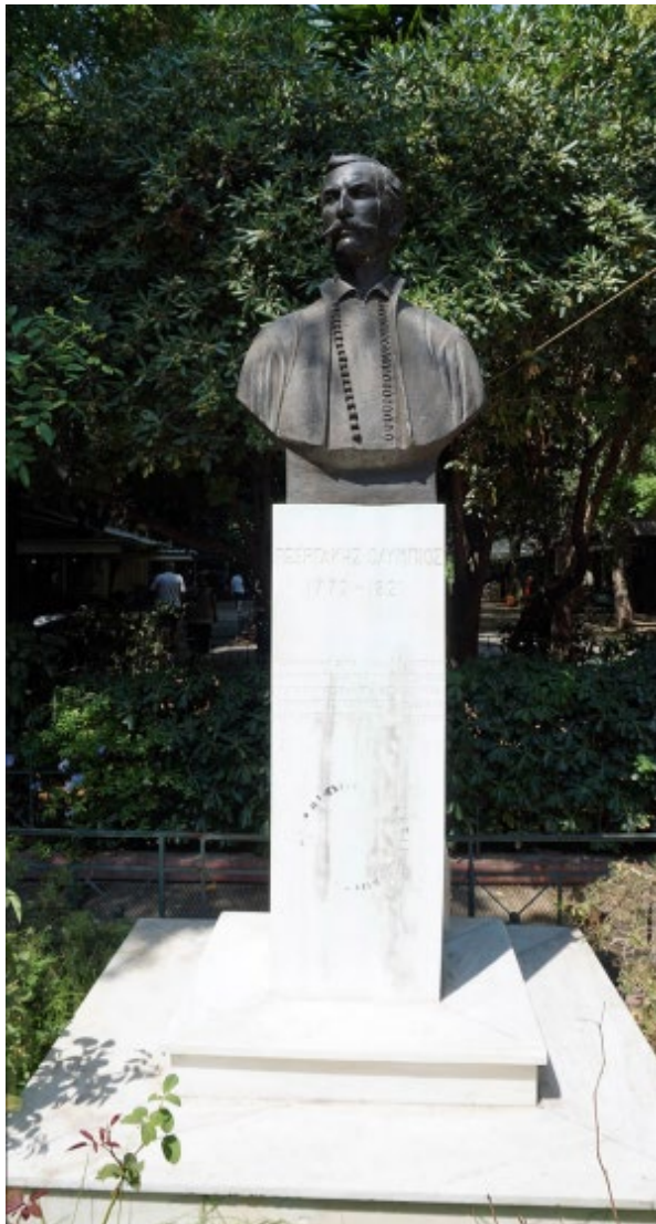
Εικόνα 6. Προτομή του Γεωργάκη Ολύμπιου, Τόπος - Αθήνα

δημόσιο και πολυσύχναστο χώρο. Χρονολογία τοποθέτησης: Τα αποκαλυπτήρια έγιναν στις 6 Οκτωβρίου 1997.