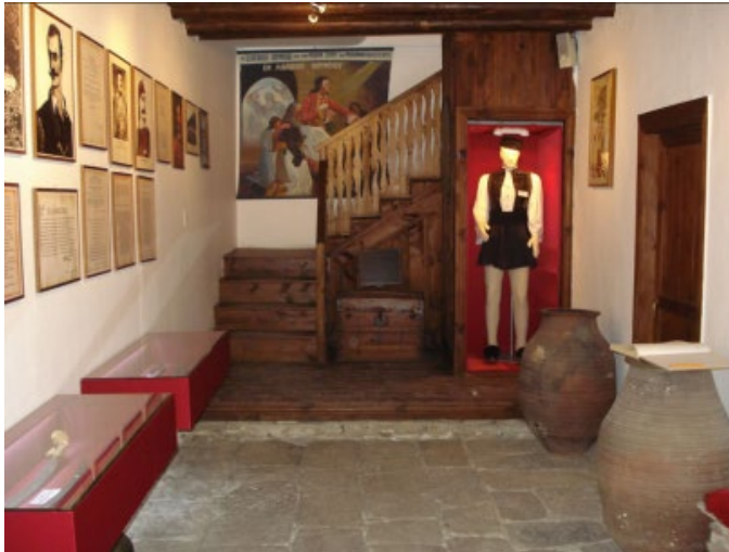
Εικόνα 1. Μουσείο Γεωργάκη Ολύμπιου, Λιβιάδι

Λιβιάδι Ολύμπου, οι κάτοικοι τον μνημονεύουν στο μουσειακό χώρο της οικίας του, η οποία αποκαταστάθηκε το 1950 και συντηρείται από την κοινότητα και τους συλλόγους.