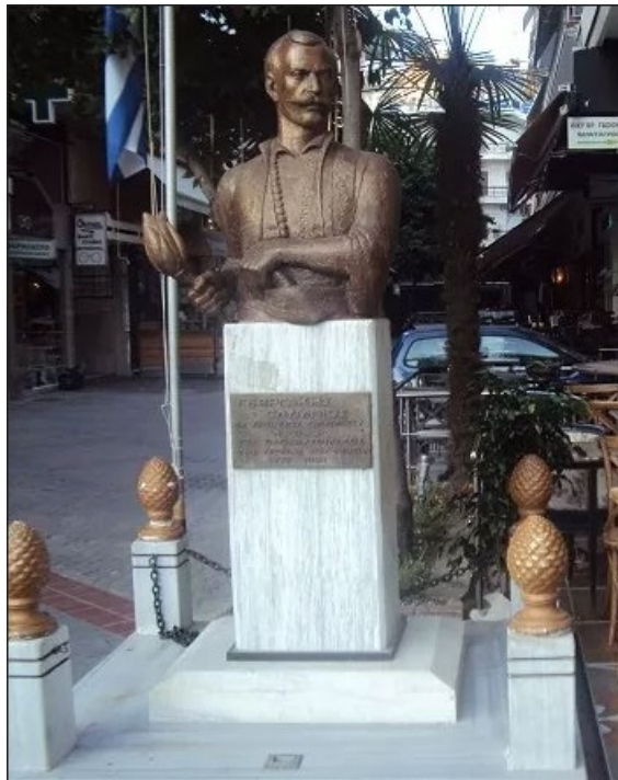
Εικόνα 7. Προτομή του Γεωργάκη Ολύμπιου, Τόπος - Κατερίνη

Σημειωτική τεκμηρίωση του έργου (Εικ. 6): Υλικό: Ορειχάλκινη προτομή, Βλέμμα: στερεοτυπική απόδοση του βλέμματος, ό.π. Μορφολογικά σημαίνοντα: Πάνω σε μαρμάρινη βάση στηρίζεται ορειχάλκινη προτομή χωρίς άνω άκρα σε ωριμότερη ηλικία και σε κυκλική απόδοση του ενδυματολογικού σημείου. Πομπός-παραγγελιοδότης: Πρωτοβουλία και δωρεά από το Σύλλογο Λιβαδιωτών Αθήνας «Γεωργάκης Ολύμπιος», που σημαίνει την τοπικότητα της καταγωγής του. Πομπός-δημιουργός: Το έργο φιλοτεχνήθηκε από τον γλύπτη Θεόδωρο Παπαγιάννη (1942), που γεννήθηκε στο Ελληνικό των Ιωαννίνων. Χώρος τοποθέτησης: Πεζόδρομος στο Κουκάκι στην ομώνυμη οδό, μία πολυσύχναστη τοποθεσία, ως αναγνώριση του βόρειου αγωνιστή Γεωργάκη Ολύμπιου από τους κατοίκους της πρωτεύουσας. Χρονολογία τοποθέτησης: Τα αποκαλυπτήρια πραγματοποιήθηκαν στις 10 Μαΐου 1998.