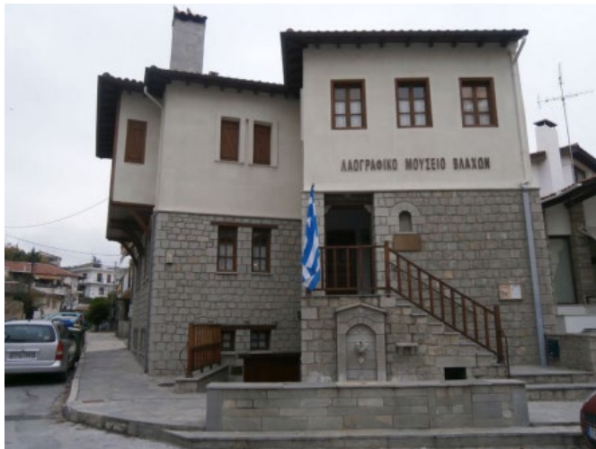
Εικόνα 10. Λαογραφικό Μουσείο Βλάχων

Επιπροσθέτως εντοπίσαμε και το Λαογραφικό Μουσείο Βλάχων στις Σέρρες.