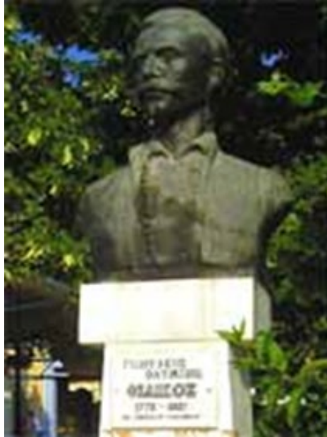
Εικόνα 4. Προτομή του Γεωργάκη Ολύμπιου, Τόπος - Ελασσόνα

Κανακάκης (1903-1978) από την Κούφη Ρεθύμνης της Κρήτης. Χώρος τοποθέτησης: Κιόσκι Λιβαδίου, που σημαίνει την τοπικότητα της καταγωγής του αγωνιστή. Χρονολογία τοποθέτησης: Τα αποκαλυπτήρια έγιναν το 1965 με παρουσία πολιτικής και στρατιωτικής ηγεσίας, που σημαίνει την προσπάθεια αναβίωσης της εθνικής μνήμης και τόνωσης του εθνικού αισθήματος στην επαρχία. Το ερμήνευμα είναι η αγωνιστική, επιθετική απόδοση του Γ. Ολύμπιου.