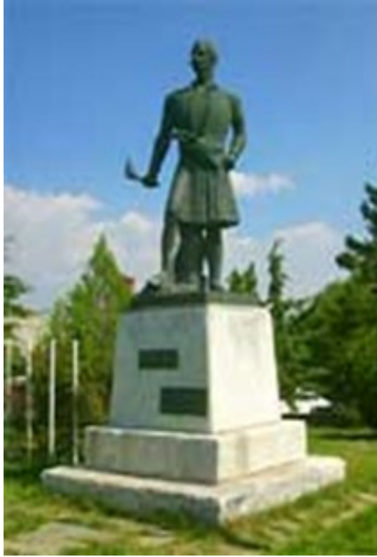
Εικόνα 3. Ανδριάντας του Γεωργάκη Ολύμπιου, Τόπος - Λιβάδι

Σημειωτική τεκμηρίωση του Ανδριάντα του Γεωργάκη Ολύμπιου στο Λιβάδι (Εικ. 3): Υλικό: Χάλκινος ανδριάντας, Βλέμμα: Πλάγιο, στραμμένο πάνω και δεξιά, που προσδίδει ζωντάνια και ορίζεται από τη «γραμματική της εικόνας» (Kress & Leeuwen, 1996) ως προσφορά στο κοινό. Μορφολογικά σημαίνουντα: Πάνω σε μαρμάρινη βάση στηρίζεται χάλκινος ανδριάντας σε κίνηση, με παραδοσιακή φορεσιά αρματολού και στο δεξί χέρι κρατάει δαυλό, που δηλώνει την επαναστατική δράση με επιπλέον ιστορικά σημαίνουντα για τον τρόπο του θανάτου του. Πομπός-παραγγελιοδότης: Σύλλογος Λιβαδιωτών Αθηνών, που σημαίνει την ανάγκη των Βλάχων της Αθήνας να τοποθετηθεί ένα άγαλμα στη γενέτειρα του Γεωργάκη Ολύμπιου. Πομπός-δημιουργός: Γιάννης